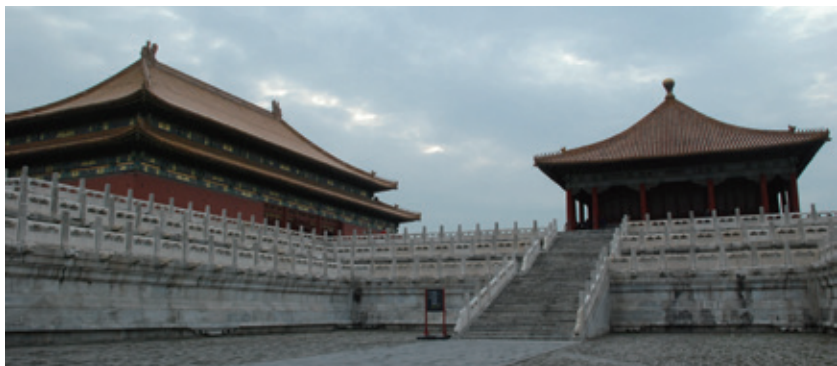
虎殿顶和攒尖顶（故宫）

还有一种屋顶，叫作攒尖顶，就是我们经常在亭子、塔上看到的那种尖顶，没有正脊，有四条或多条垂脊，正中还有一个圆圆的宝顶。