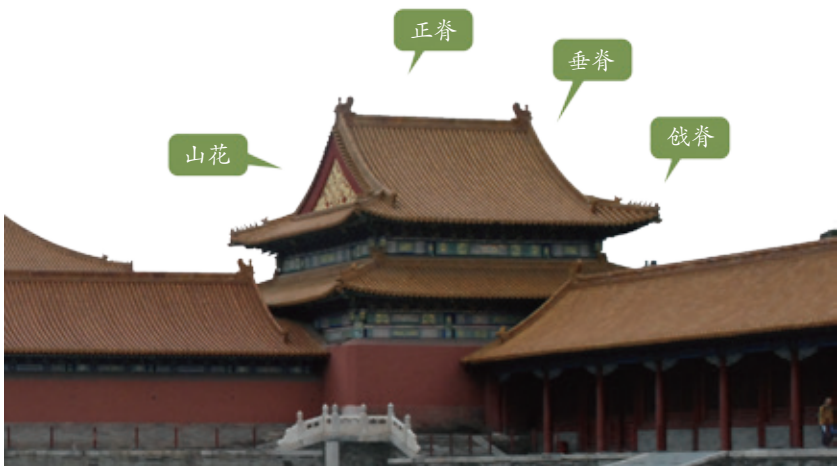
歇山顶各部分示意图

以上两种是宫殿或寺庙等高级别建筑所用的屋顶，下面这两种就是民居常用的了，一种叫作“硬山顶”，另一种叫作“悬山顶”。